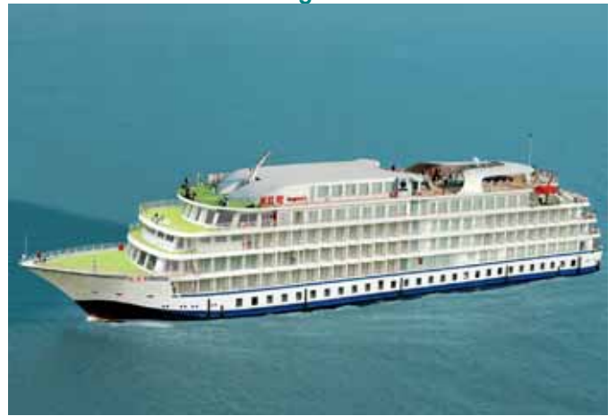
MS Yangzi 1 *****