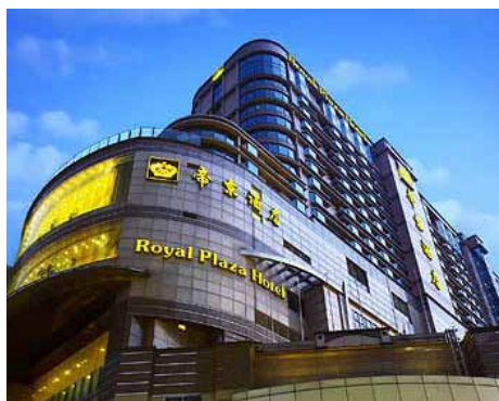
Royal Plaza Hotel**** in Hongkong