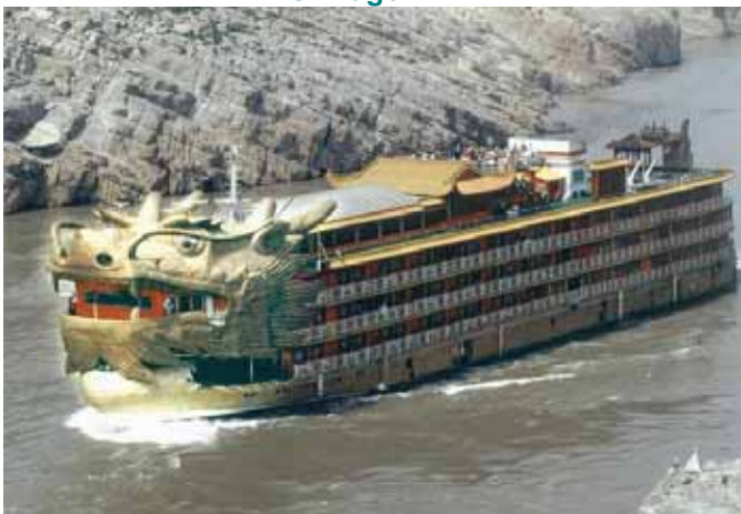
MS Dragon *****