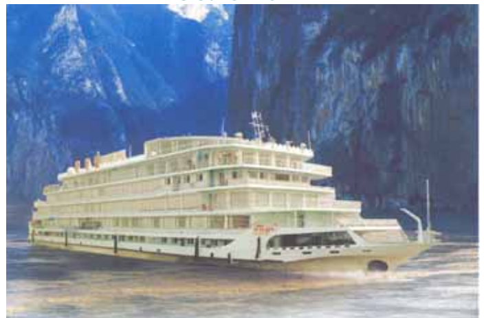
MS Sunshine ****