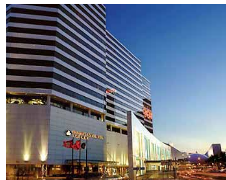
Renaissance Kowloon**** in Hongkong