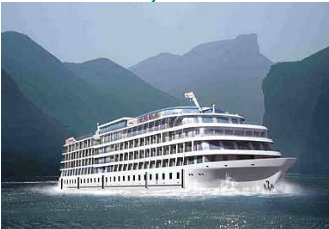
MS Century Diamond *****