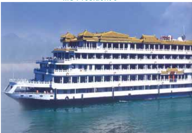
MS President 3 ****